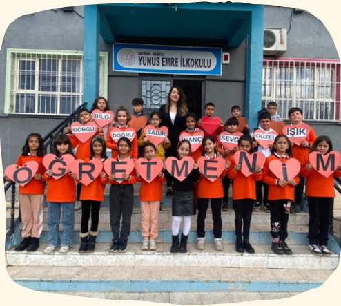
Öğretmenler günü kutlandı.