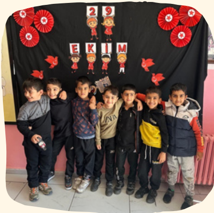
Cumhuriyet Bayramı kutlandı.