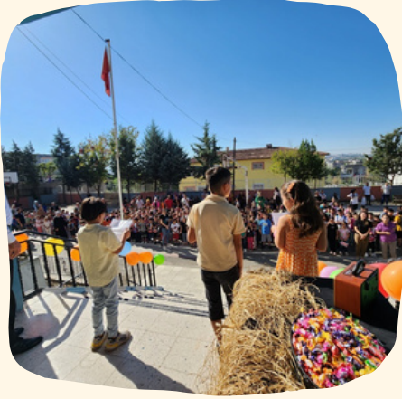
İlköğretim Haftası kutlandı.