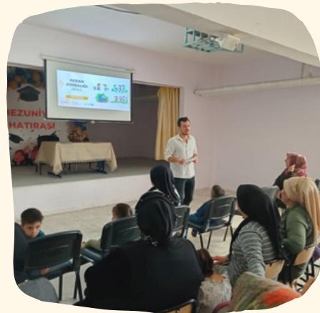
Akran Zorbalığı semineri

an buka stilahnya, ar saja be- ya. g terjadi ke- emucu kuat s. Contohnya ng. Memang a yang mem- panjangan se- cabai kurang idak ya paling Maka, yang terjadi adalah salah penangan dilakukan penanganan di dua area, yaitu di petani (on farm) produksi. Untuk yang petani cabai pe kret