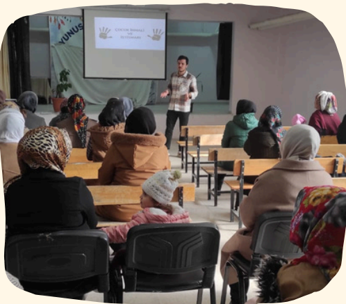
İhmal İstismar Veli Semineri

...a new ...mic achieve ...recruited athlet ...the day when a ...of SAT scores will be ...a letter from an agen ...generate a lucrative cost ...pected a lucrative cost ...scholars will hold pres ...to announced which for ...the recruiting battle for ...services Successful adve ...tion who will become highly po ...their ranking in the Barron ...of American Colleges ...These leading colleges ...crossed application in the ...of giving no-need awards ...have been conducted in the ...to determine how much m ...is required to cover a student ...from a first-choice institu ...other and how much m ...levels of student ...house! ...tion of an ...we in their ...rather than to make a choice ...of academic or other fac- ...the institution and the student ...These "scholarships" are defende ...as rewards for past scholar- ...ment! The defenders often point out ...that it is laudible that schools ser- ...recognize scholars the way they have ...recogized scholars But neither are ...ships nor scholars are given scholar- ...ments Scholarships are given scholar- ...for services rendered Athletes contrib- ...ply their talents to the success of an ...institution's teams. Scholars contrib- ...ute to the marjoring success of the in- To attract the best st