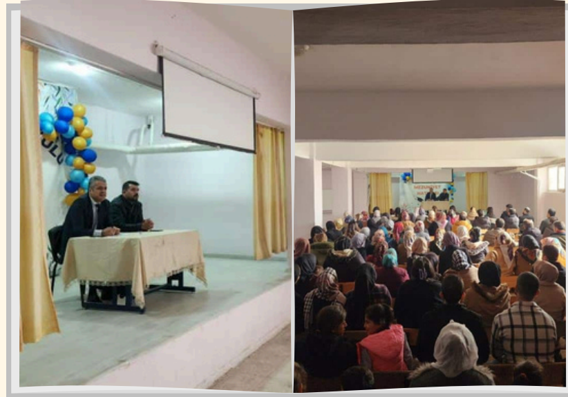
Okul Aile Birliği Toplantısı