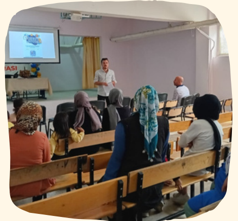
Rehberlik Servisi Tanıtıldı